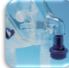
Configurazione con ventilatore monotubo o generatore CPAP