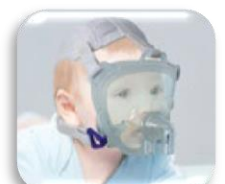
DiMax Zero XS/Pediatrica