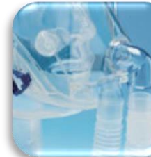
Configurazione con ventilatore bitubo