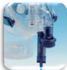
Configurazione per CPAP con generatore Venturi "Easy Vent"