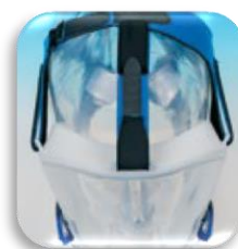
Il 5° punto di fissaggio consente una maggior tenuta sulla fronte del paziente