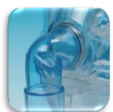
Raccordo "NonVented" per ventilatore bitubo