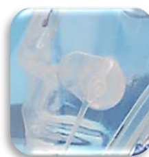
Passaggio dedicato per sondino nasogastrico SNG