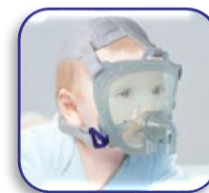
DIMAX ZERO XS/Pediatrica

Le immagini e i contenuti riprodotti sono indicativi e non vincolanti