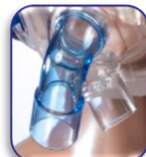
Raccordo "NonVented" per ventilatore bitubo