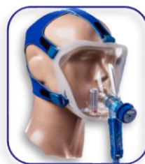
Configurazione per CPAP con generatore Venturi "Easy Vent"