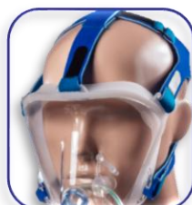
Il 5° punto di fissaggio consente una maggior tenuta e maggior comfort