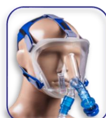
Configurazione con ventilatore monotubo o generatore CPAP