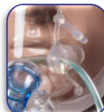
Passaggio dedicato per SNG