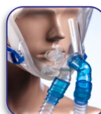
Configurazione con ventilatore bitubo